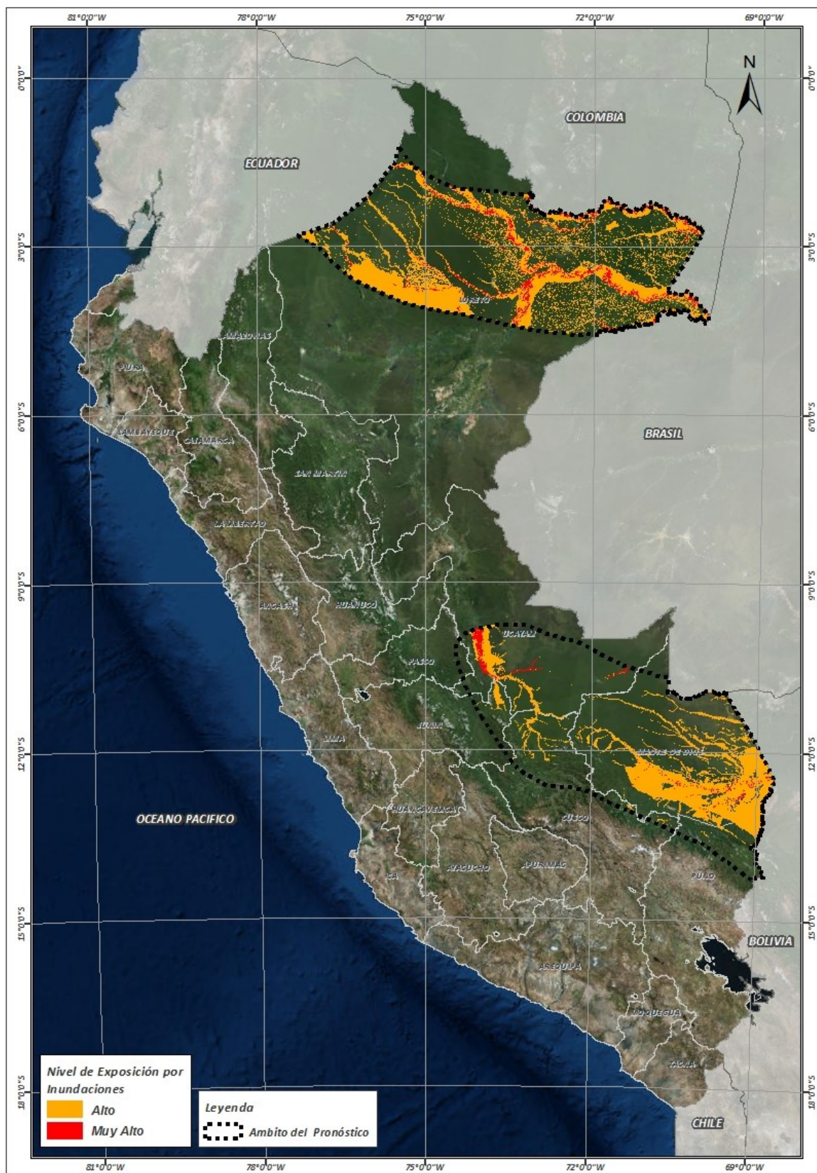
Figura N° 1: Mapa de exposición alta y muy alta por inundación

Fuente: CENEPRED, elaborado con información del SENAMHI e INGEMMET.